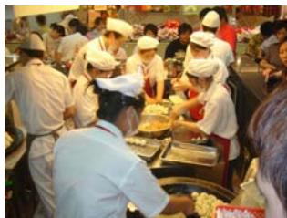
Shanghai, marché alimentaire, hygiène lors de la production de «dumplings» (boulettes de pâte), un endroit idéal pour tester le UniQ FD.

mécanique dans les différents secteurs industriels que sur le plan d'un nettoyage responsable dans les entreprises de traitement alimentaire.