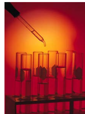
Een reinigende oplossing op maat van uw wensen.

Voor elk probleem is er een oplossing, dat is het probleem niet