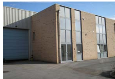
Onze nieuwe kantoren & magazijn te Temse

Hier hebben we een ruimer oppervlak met een aparte opleidingsruimte en kunnen we onze R&D afdeling vergroten, zodat we sneller een antwoord vinden op uitzonderlijke reinigingsproblemen.