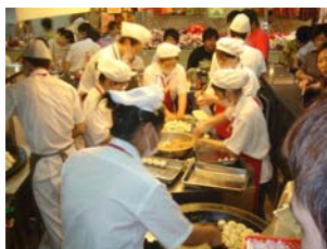
Shangai, foodmarket, hygiëne bij de productie van "dumplings" een ideale plek om UniQ FD te testen.

onderhoud in de verschillende industrietakken, als de verantwoorde reiniging bij de voedingsverwerkende bedrijven werden oplossingen aangeboden.